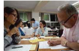
体験プログラム作りワークショップ

長良川温泉にある旅館・ホテルの協同組合、観光コンベンション協会など既存の観光関係団体に加え、これまで地元でまちづくりを推進してきたまちづくり会やNPO法人等が実行委員会を組織し、行政とも連携しつつ、取組を実施している。