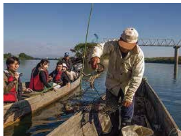
川漁師を体験するプログラムの様子