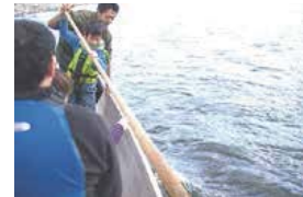
長良川の船頭を体験するプログラムの様子

長良川は源流を岐阜県郡上市高鷲の大日ヶ岳に発し、多くの支流と合流し木曾三川の一つとして伊勢湾に流れ込んでいる。現在、長良川流域で生活している人々は80万人以上と言われ、その多くが、良質の水質を誇る長良川の伏流水を飲み水、生活用水として利用している。長良川流域エリアには、鶴岡や美濃和紙の手漉き技術等、長良川によって育まれた歴史・文化・知恵が今なお多く息づいている。